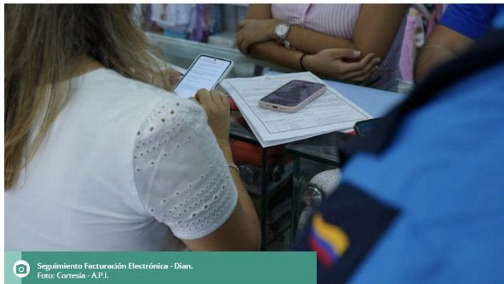
Seguimiento Facturación Electrónica - Dian.

Si bien una gran medida está cumpliendo, la Dian anunció que irá por aquellos que no reportan todo lo que venden.